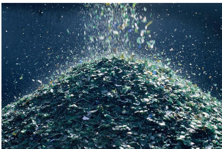
Återvunnet krossglas vid Svensk Glasåtervinning (SGÅ) glasåtervinningscentral i Sverige